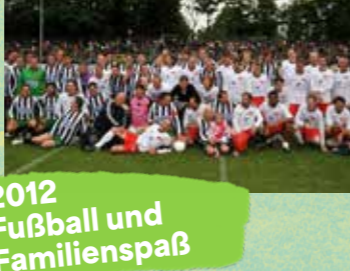
2012 Fußball und Familienspaß