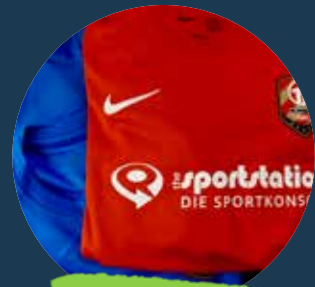
11 Team Sport Tolle Kleidung