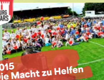
2015 Die Macht zu Helfen

Die vollends begeisterten Zuschauer sahen mit einem 7:6 die bisher torreichste Begegnung, denn es musste nach dem Halbzeitergebnis von 2:0 für die Ärzte erstmals ein Unentschieden-Ergebnis (2:2) durch Elfmeterschießen entschieden werden. Ein rundum erfolgreicher Tag für die KINDER-HERZ-MEDIZIN in Hamburg.