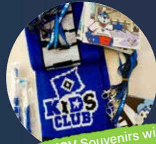
HSV Souvenirs wie Zahnbürsten, Schal, Stundenpläne