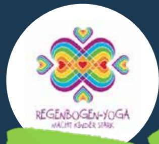
Regenbogen-Yoga 20 Gutscheine