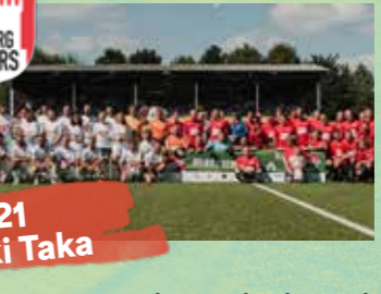
2021 Tiki Taka

Trotz der Pandemie wurde die 12. Auflage „Kicken mit Herz“ unter dem Motto „TIKI TAKA“ grandios abgefeiert. Ein Spiel, was Wochen im voraus ausverkauft war. Den Anstoß übernahm Hamburgs Bürgermeister Peter Tschentscher. Am Ende gewannen die Allstars (7:5) - doch eigentlich steht es 12:0 für die KINDER-HERZ-MEDIZIN.