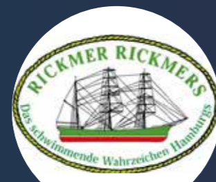
Rickmer Rickmers Gutscheine