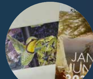
Hamburger Kunsthalle Gutscheine