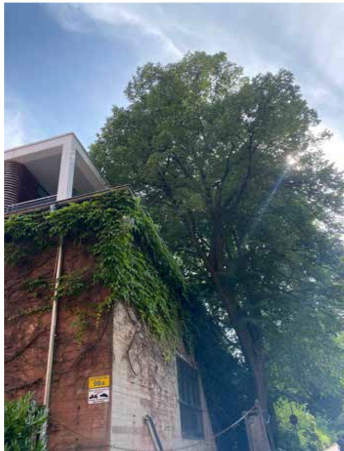
Adresse: Universitäres Herz- und Gefäßzentrum Hamburg Gebäude Ost 33, Martinstraße 52, 20246 Hamburg

Betreut wird das Familienbaumhaus vom Team der Kinderherzstation. Aus Spenden von KICKEN MIT HERZ wurde das Familienbaumhaus renoviert und neue Anschaffungen getätigt. Es fehlt noch eine neue Küche und daher zählt jedes Los, das am Spieltag von KICKEN MIT HERZ verkauft wird. Denn das kommt dem Familienbaumhaus zugute!