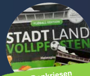
Denkriesen Spielblöcke & Kartenspiele