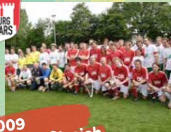
2009 Zweiter Streich

Zum zweiten Mal trafen die Hamburg Allstars auf die Placebo Kickers des UKE. Vor erneut großer Kulisse im Stadion an der Hoheluft gewannen die Allstars nach einer torreichen und spannenden Partie mit 7:5 (3:4).