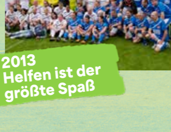
2013 Helfen ist der größte Spaß