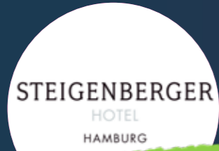
Eine Übernachtung in einem Standard-Doppelzimmer inklusive reichhaltigem Frühstücksbuffet für zwei Personen im Steigenberger Hotel Hamburg