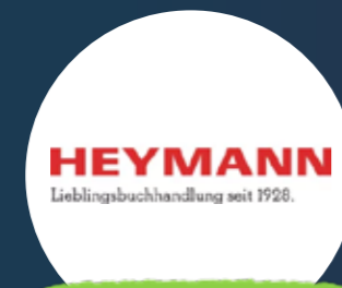
Heymann ganz viele tolle Bücher