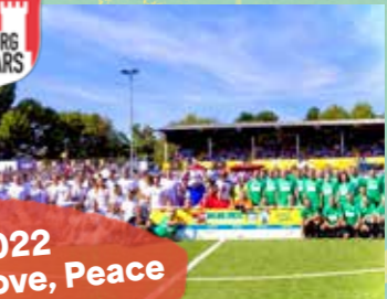
2022 Love, Peace & Soccer

2022 stand unter dem Motto Soccer, Peace and Love. Bei Sonnenschein gab es ganz viel Liebe auf dem Rasen und eine Rekord-Spendensumme von 184.500 Euro. Auch wenn die Allstars gewannen, steht es weiter 14:0 für die KINDER-HERZ-MEDIZIN.