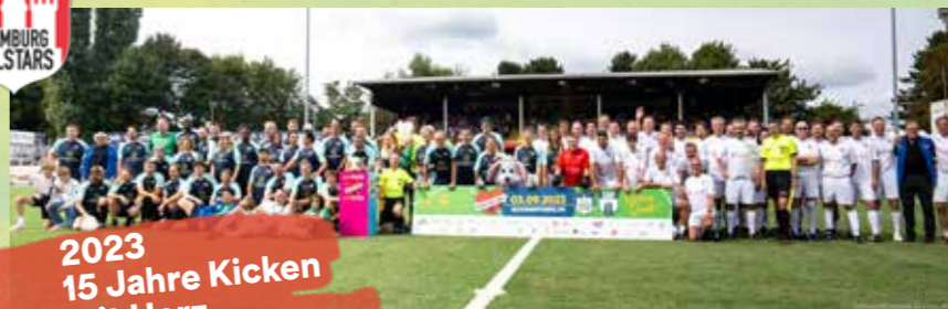
2023 15 Jahre Kicken mit Herz

2023 gab es neben Sonnenschein einen knappen Sieg mit 8:9 für die Hamburg Allstars. Und endlich gab es das bislang erste und einzige Super-Tor von Bjarne Mädel, sowie eine tolle Spendensumme von 195.000 Euro und das zum 15-jährigen Jubiläum!