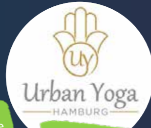
Urban Yoga Gutscheine