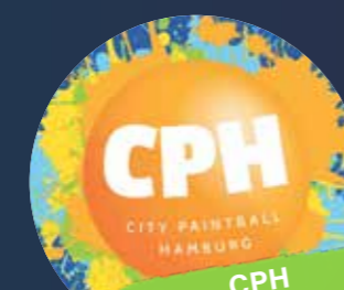
CPH City Paintball Gutscheine